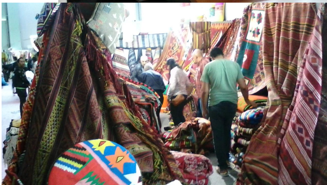
تهیه و تنظیم: مجید قربانی فراز-وابسته بازرگانی سفارت ج.ا.ایران در تونس