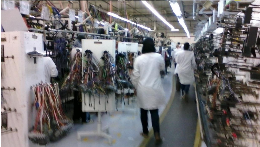
تهیه و تنظیم گزارش: مجید قربانی فراز-وابسته بازرگانی سفارت ج.ا.ایران در تونس